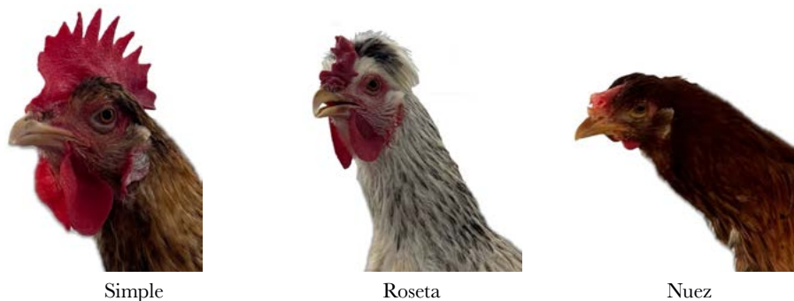
Figura 3. Tipos de cresta presente en las aves Criolla ( Gallus gallus D. )

FR=frecuencia relativa, FA=Frecuencia acumulada, N=normal, B=barrado, L=Lanceado, M=moteado, O=otro.