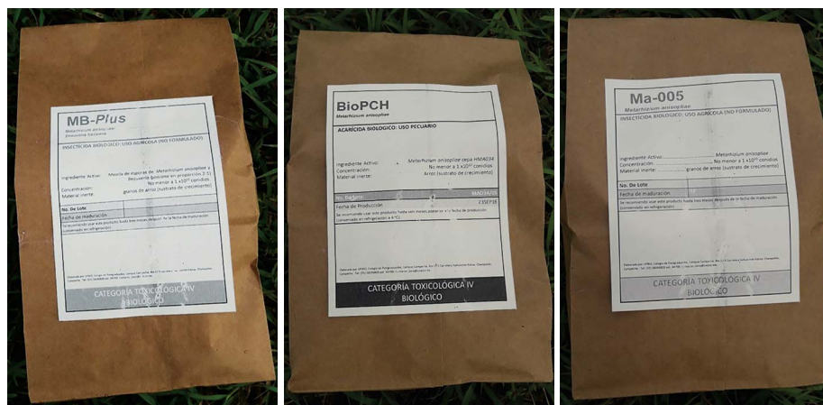
Figura 2. Presentación comercial de los biopesticidas a base de hongo Metarhizium anisopliae para el control de la mosca pinta ( Aeneolamia sp.) en caña de azúcar, pastos y hortalizas.