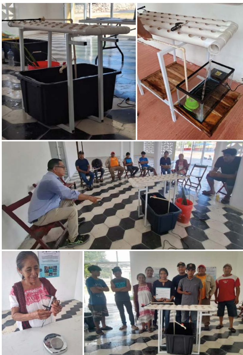
Figura 2. Sistemas acuapónicos y capacitación a productores cooperantes de zonas rurales del estado de Campeche.

Al proyecto CONV_PROTTINS_20_25_01_02 del Colegio de Postgraduados Campus Campeche y Estancias Posdoctorales por México–Inicial Mujeres Indígenas 2023(1) con CVU 330223.