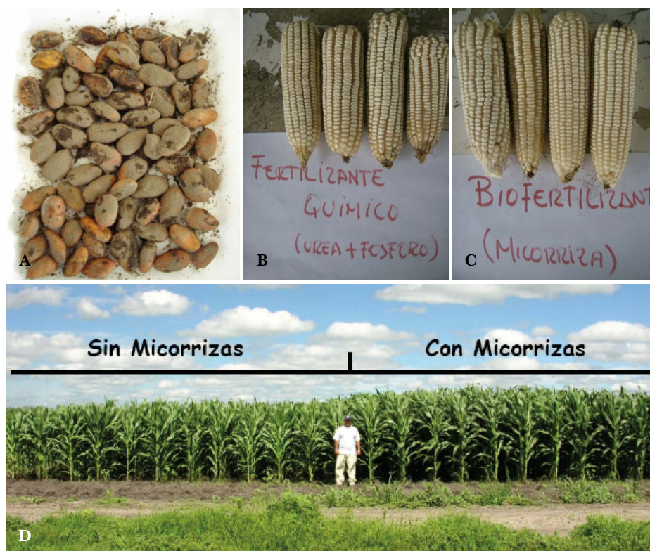
Figura 2. A: Semilla de frijol inoculada con micorrizas antes de la siembra. B: Mazorcas de maíz obtenidas con fertilizante, y su comparación con las obtenidas de plantas inoculadas con micorrizas. C: Diferencia en crecimiento de plantas de maíz cultivadas con y sin micorrizas. D: Diferencia en crecimiento de plantas de maíz cultivadas con y sin micorrizas.