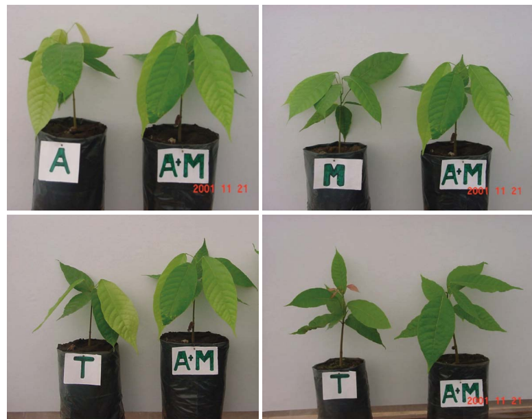
Figura 3. Plántulas de cacao ( Theobroma cacao L.) en vivero, tratadas con y sin biofertilizante a base de microorganismos. T: testigo; A+M: Azospirillum brasilense más micorriza.