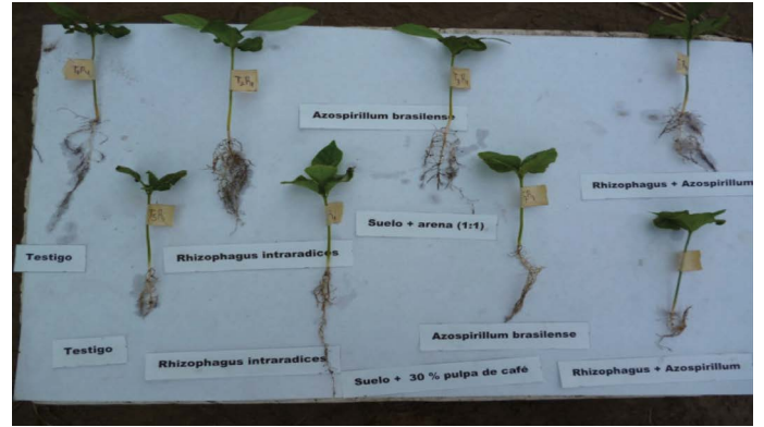
Figura 2. Plántulas de café ( Coffea arabica L.) en vivero, tratadas con y sin biofertilizante a base de microorganismos.