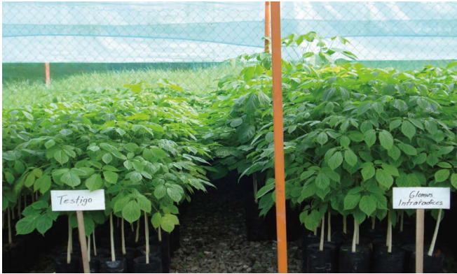
Figura 1. Plantas del árbol primavera ( Tabebuia donnell smithii Rose), en vivero, tratadas con y sin biofertilizante a base de microorganismos.