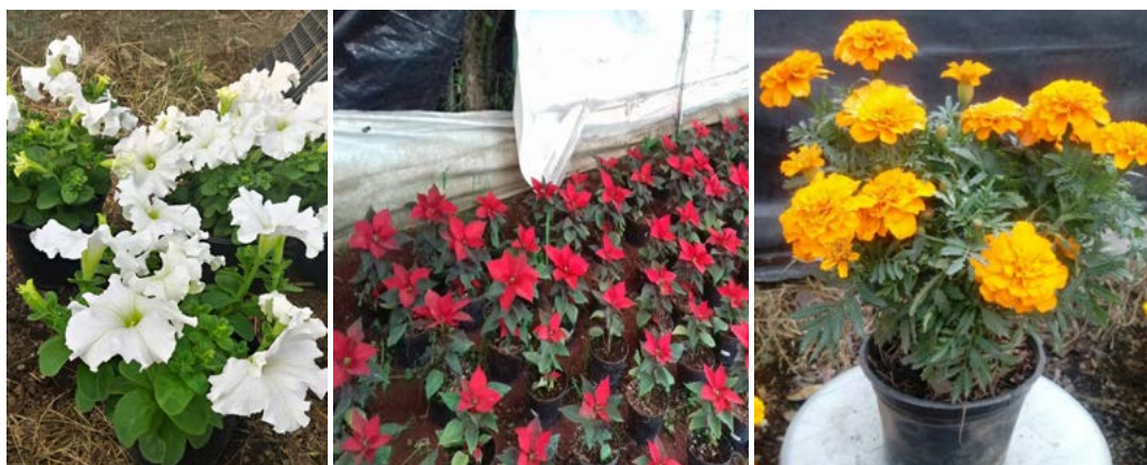
Figura 4. Cultivos de petunia, nochebuena y cempasúchil cultivados bajo invernadero en mezclas de sustratos con Mlc.

La mezcla se preparó utilizando tierra de monte (Tm) y tierra negra (Tn), extraídas de una zona forestal de pino-encino del Municipio de Villa del Carbón, Estado de México; tezontle (Tz), fibra de coco (Fc) y agrolita (Ag) obtenidos de comercializadores locales. El único componente que se modificó en cada tratamiento fue la cantidad de Mlc aportado. En el cultivo de nochebuena, el tratamiento fue la sustitución de la tierra de monte en 0% y 20%. En los tratamientos con petunia y cempasúchil la sustitución de la Tm fue del 0% y del 100% (Cuadro 2).