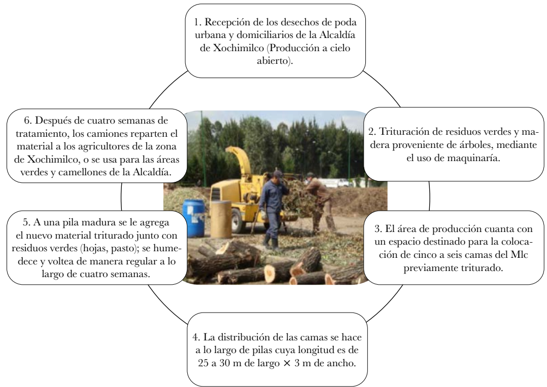
Figura 2. Producción de Mlc en el Centro de Composteo “El Axolotl”, en Alcaldía Xochimilco.