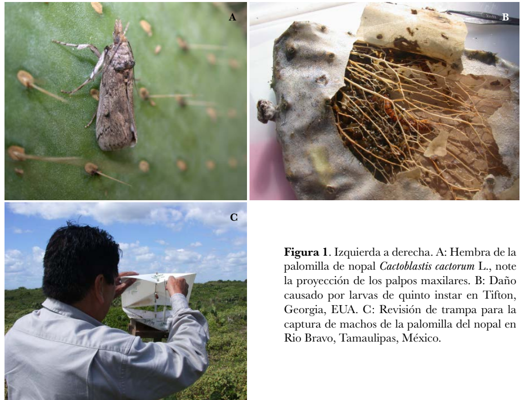
Figura 1. Izquierda a derecha. A: Hembra de la palomilla de nopal Cactoblastis cactorum L., note la proyección de los palpos maxilares. B: Daño causado por larvas de quinto instar en Tifton, Georgia, EUA. C: Revisión de trampa para la captura de machos de la palomilla del nopal en Río Bravo, Tamaulipas, México.