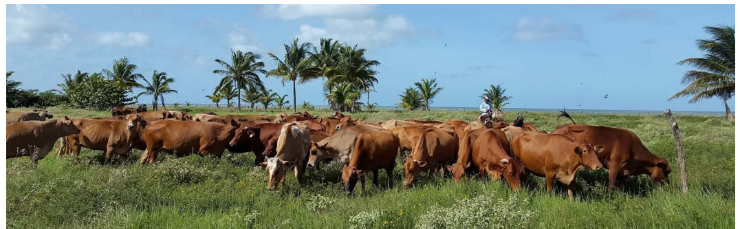
Figura 2. Novillonas criollas Lechero Tropical en Frontera, Tabasco.